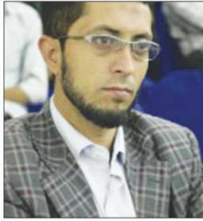
مثل قناة سهيل وجامعة الايمان ومؤسسة القناتة وغيرهن .

وتقع سائله بله بمحافظة لبحج وتبعد عن مدينة الحوطه مركز المحافظة حوالي ٥٠ كيلو وعن مثلث العند حوالي ٥ كيلومتر .