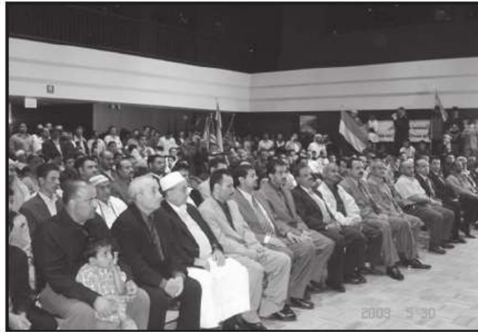
محافظة إب في الداخل والخارج .