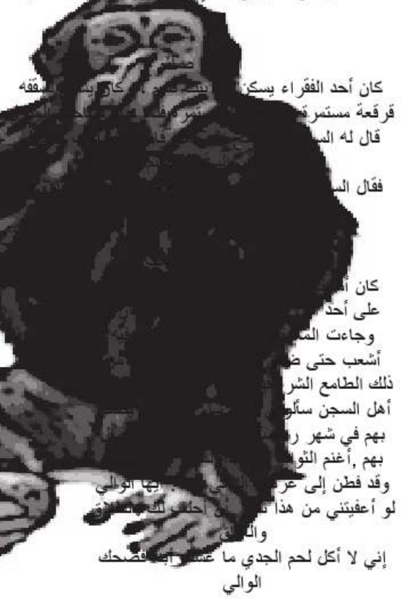
كان أحد الفقراء يسكن في بيت

الموت قبل الإفطار رؤى أعرابي وهو يأكل فاكهة في نهار رمضان فقيل له: ما هذا؟ فقال الأعرابي على الفور: قرأت في كتاب الله "وكلوا من ثمره إذا أثمر" والإنسان لا يضمن عمره وقد خفت أن أموت قبل وقت الإفطار وقد مات عاصياً