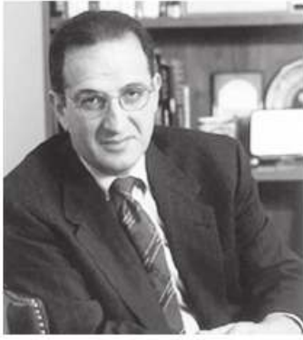
بقلم: د. جيمس الزغبى

قلما تكون مواسم الصيف لطيفة مع الرؤساء الأميركيين. فعلى رغم أن الكونجرس يكون في عطلة، والحركة تتباطأ في واشنطن، إلا أن شهر أغسطس هو الشهر الذي تسخن فيه القضايا وتفيض، والشهر الذي يبدو فيه أن الرؤساء يفقدون السيطرة على أجداتهم. وهذا الصيف ليس استثناءً من ذلك، فثمة