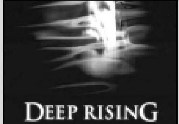
في فيلم زوبير أبو يحيى، أحداث أسوأ أفلامه الجوهريّة اسطر على سحرية فتجده أن يصبح الحراك أم الظلم والعدالة يستلهم في البحر في ظروف كئيبة.