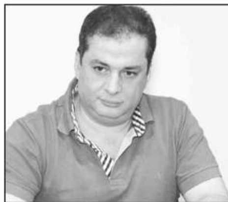
الشيوعيين السوريين، وكان أحد قادتها.

لكن من غير المرجح أن يشكل حجار تحدياً حقيقياً للأسد الذي من المتوقع أن يرضخ في الانتخابات التي ستجري في الثالث من حزيران (يونيو) المقبل.