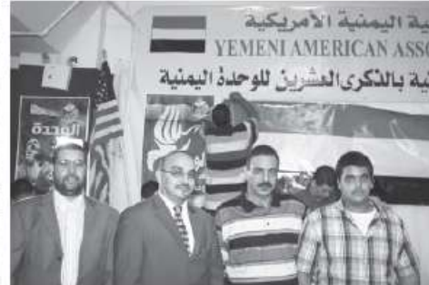
فئة اليمنية الأمريكية YEMENI AMERICAN ASSO شبة بالذكرى العشرين للوحدة اليمنية