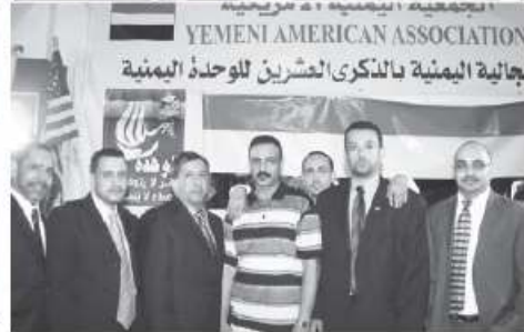
YEMENI AMERICAN ASSOCIATION لجالية اليمنية بالذكرى العشرين للوحدة اليمنية