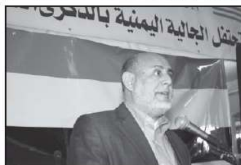
تحتفل الجالية اليمنية بالذكرى