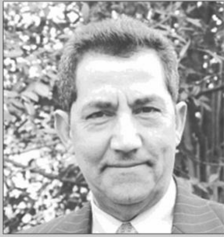
هل ستقوم الدولة الفلسطينية المستقلة عن طريق مجلس الأمن؟

والجواب نعم ولكن هناك ثلاثة شروط لقيامها، أولا النضال على الأرض من خلال إنتفاضة سلمية متواصلة شاملة متصاعدة يشترك فيها جميع شرائح الشعب من قيادات وطلاب ونساء وأطفال ورجال وفصائل ومجتمع مدني تقنع العالم كله بأن الشعب الفلسطيني واحد موحد في رفض الإحتلال وأنه قرر أن يواصل ثورته السلمية لغاية كسب الإحتلال مرة وإلى الأبد. والشروط الثاني استثمار التعاطف الدولي العام لتحويله إلى قوة ضغط أخلاقية تحاصر إسرائيل وتعزلها كما فعل المؤتمر الوطني الأفريقي عندما حول التراجع العسكري عام 1985 أمام ضربات التمسانح بيك بونا إلى حركة تعاطف عالمية وخاصة في أوروبا حيث فتحت العواصم أمام نضالهم العادل ولم يبق يعاند ذلك الزخم إلا رئيسة وزراء بريطانيا مارغريت تاشر وصديقتها العزيز رونالد ريفان وانهار الإثنان أخيرا تحت تأثير الضغط البرلماني والشعبي وسقط بعدها نظام الأبرتايد في جنوب أفريقيا. أما الشرط الثالث فهو الالتفاف العربي الشامل حول هدف إقامة الدولة الفلسطينية حقيقة لا مراء ونفاقا في العلن وفي الخفاء يتم التنسيق مع إسرائيل وتبادل الزيارات والتجارة والسياحة وتناول طعام الغداء مع تسييفي لثني في نيويورك بحضور سبعة وزراء خارجية عرب وأميين عام الجامعة قبيل إفتتاح دورة الجمعية العامة في 23 أيلول/سبتمبر أي بعد أقل من شهر من مجزرة غزة. هذه هي المصيبة التي تؤخر وتعطل قيام الدولة الفلسطينية.