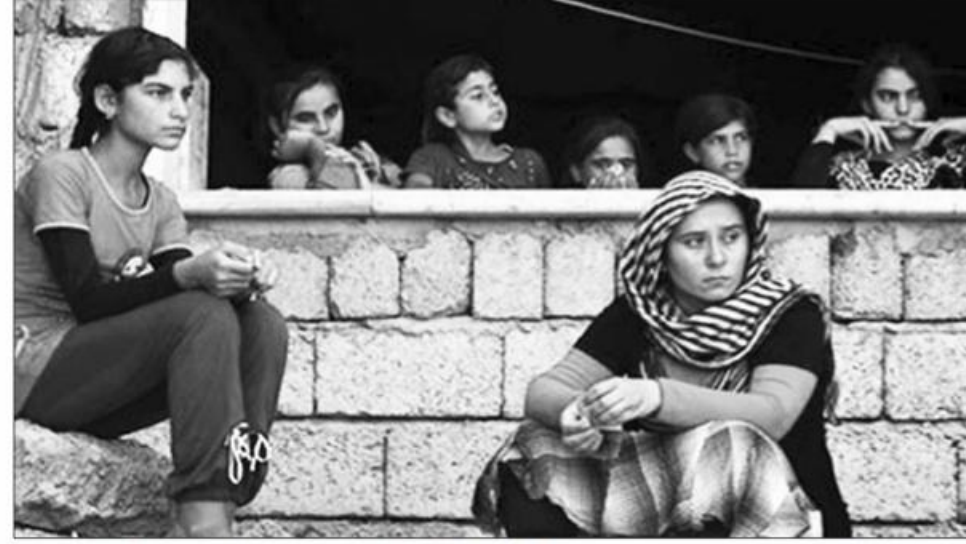
العديد من الأيزيديات خلال الهجوم على منطقة جبل سنجار في شمال العراق الصيف الماضي. وأكد المرصد "توثيق قيام عناصر التنظيم ببيع اللواتي تم بيعهن وتزويجهن.

عربية مؤتمرات للأزهر الشريف والأوقاف نظراً لوجود قواسم مشتركة".