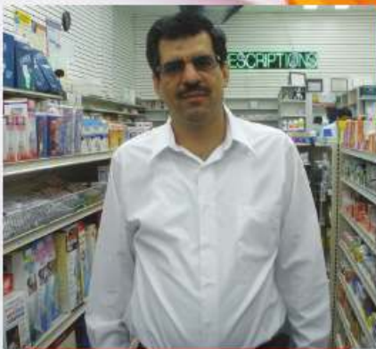
بإدارة: أمجد حسين

We gladly accept Medicaid, Most Insurance & Major Union Plans