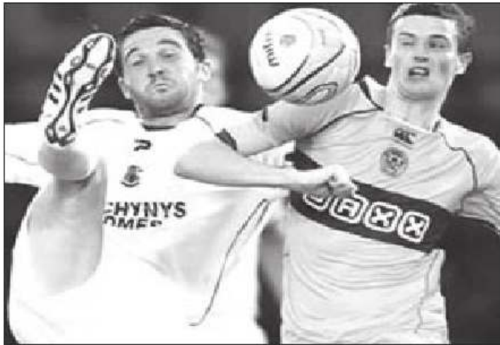
وكانت أبرز النتائج الأخرى في هذه المرحلة فوز أنورثوسيز القبرصي على ضيفه كايرينغ (لكسمبورغ) بخمسة أهداف دون مقابل، وروزنبورغ

النرويجي على ضيفه فريق رونافيك (جزر الفارو) 3-0 (صفر). كما تغلب هيلسنغبورغ السويدي على ضيفه ميكا الأرميني بثلاثة أهداف مقابل هدف، سجل منها المهاجم المخضرم هنريك لارسون ثنائية. وقاد سرجي كيسلياك فريق دينامو مينسك البيلاروسي لفوز صعب على ضيفه رينفوا المقدوني 1-0. كما تغلب فاليتا المالطي على كيلافيك الأيسلندي بثلاثة نظيفة في مباراة شارك فيها مع الأول خوردي كرويف لاعب برشلونة السابق ونجل أسطورة الكرة الهولندية يوهان كرويف. وتقام مباريات العودة لهذا الدور في التاسع من يوليو الجاري، علماً أن هناك ثلاثة مراحل أخرى في التصفيات ستقام بنظام الذهاب والعودة قبل انطلاق منافسات مرحلة المجموعات في 17 سبتمبر المقبل.