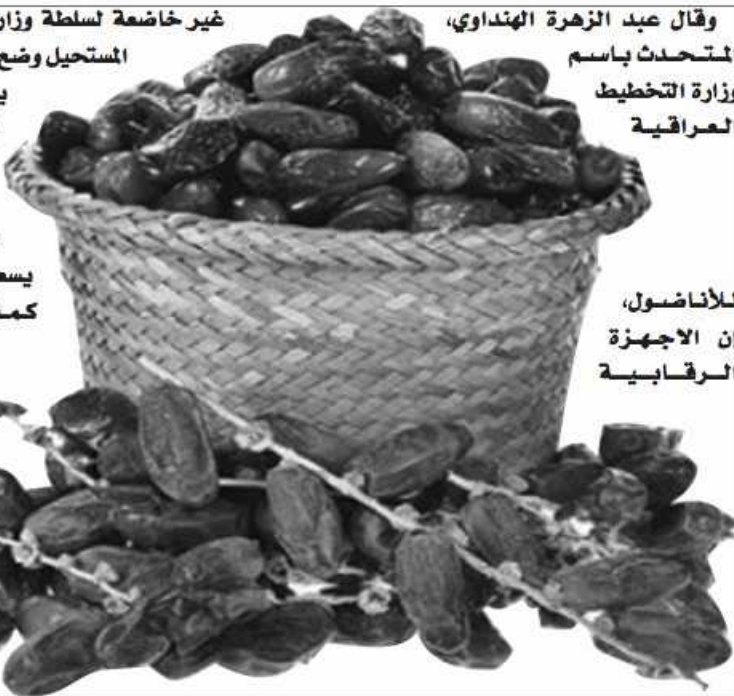
للأناضول، إن الاجهزة الرقابية

يذكر أن العراق أعلن بشكل رسمي في قوت سابق، أن عدد النخيل على اراضيه بلغ أكثر من ٢١ مليون نخلة، وأنه يسعى لإعادة زراعة النخيل كما كانت عليه في مطلع القرن الماضي، إذ تجاوزت