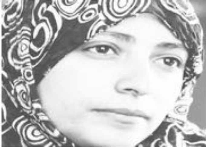
القيادات الشابة التي قادت حركة الاحتجاجات في مهدها. اليمن وجنوبه الذي يشهد حركة احتجاجات منذ العام ٢٠٠٧ . وتعتبر «كرمان» من قيادات سياسية

وتعتبر كرممان أحد أبرز الناشطات الحقوقية في اليمن وعرف عنها بذل الكثير من الجهود خلال السنوات الماضية في سبيل الانتصار لقضايا المضطهدين في اليمن والجماعات المهمشة إضافة إلى قيامها بحملات تضامن مع المعتقلين السياسيين .