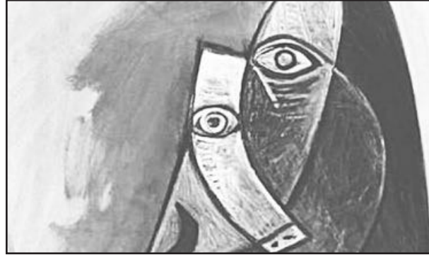
الذي يقال عنك.

اللوحه التي جابت أكثر من مكان في العالم على مدار الخمسين عاماً الماضية، في معرض فني تنظمه الأكاديمية ضمن مشروع بيكاسو في فلسطين الذي يستمر ثلاثة أسابيع. ويستمر عرض اللوحة التي تعتبر أيقونة من الفن الحديث، ثلاثة أسابيع في مبنى الأكاديمية في غرفة عرض تعتبر أول متحف للفن الحديث في فلسطين.