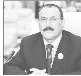
وذكر الجندي في مؤتمر صحفي اليوم الاحد ان قائد عسكري كبير مشق كان السبب في تسهيل فرار السجناء

الإرهابيين من أحد سجون المكلا الأسبوع الماضي بحسب التحقيقات الأولية .. ورحب نائب وزير الإعلام باللجنة الأممية للتحقيق المكلفة من الأمم المتحدة للتحقيق في الانتهاكات الإنسانية جراء النزاعات التي جرت خلال الشهر الماضي في منطقة الحصبة ومناطق أخرى من اليمن. وأكد نائب وزير الإعلام بأن السلطة ستسخر كل إمكانياتها للتعاون مع اللجنة الأممية للتحقيق وإنجاح مهامها .. مرحباً ببيان مجلس الأمن الدولي الصادر يوم الجمعة الماضي والذي دعا