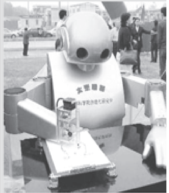
الإنسان الآلي هذا من الجيل الثالث

كشفت في الصين عن إنسان آلي «ذكي» يستطيع فهم كلام الناس والتعرف على الوجوه وحتى التعلم من الإنترنت أو من تصرفات الناس. ونشرت وكالة أنباء الصين الجديدة «شينخوا» أن المهندسين والعلماء في جامعة الصين للعلوم والتكنولوجيا بمدينة خفي بشرق البلاد نجحوا بـ «الحياء» في الإنسان الآلي «كه جيا» الذي أدخل زوار المعرض الدولي لتجارات التكنولوجيا الفائقة والجديدة بالصين بفقراته الممتيزة إذ أنه قادر على التعرف على الوجود وفهم كلام الناس وتصحيح الإنترنت لتعلم مور جديدة أو تقليد حركات الناس من دون أية مساعدة.