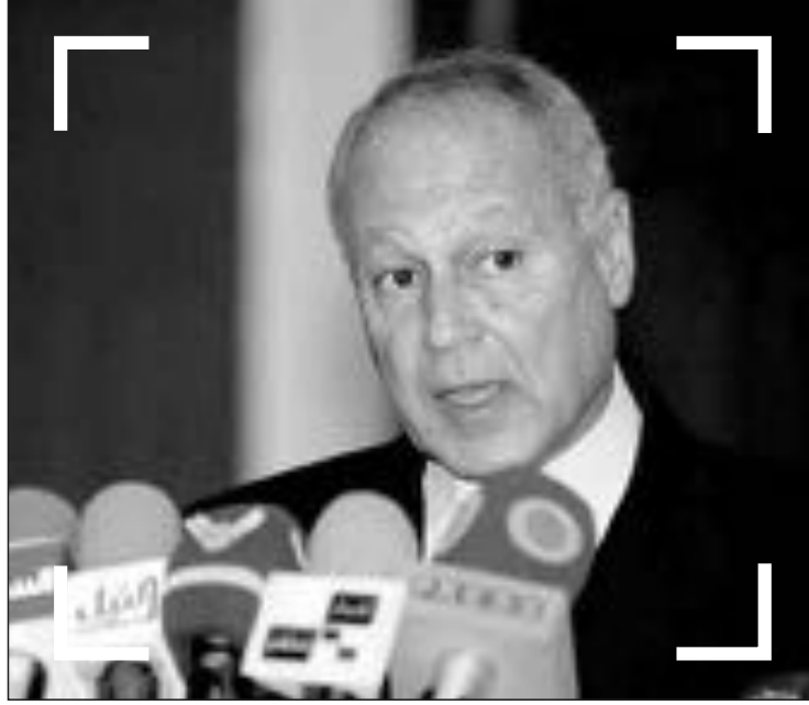
■ أحمد أبو الغيط

ويقول رجال دين مسلمون ومسيحيون ان هناك وثاما طائفيًا في البلاد. لكن نزاعات دامية تنشب أحيانا بسبب تغيير الديانة أو علاقات بين رجال ونساء ليسوا من نفس الطائفة.