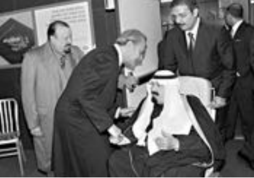
الملك عبدالله والى جانبه وزير الخارجية سعود الفيصل لدى وصوله الى نيويورك امس الاول

وعين الملك عبد الله أخيه غير الشقيق الأمير نايف نائباً ثانياً لرئيس الوزراء في عام ٢٠٠٩ في خطوة يقول محللون إنها تضمن قيادة البلاد في حالة تعرض الملك وولي العهد لمشاكل صحية خطيرة وتحسن فرص الأمير نايف في تولي العرش ذات يوم.