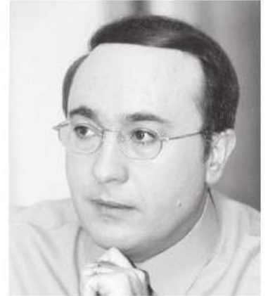
د. فيصل القاسم

× هل يستطيع أحد أن ينكر أن جماعات الضغط في أمريكا أو ما يسمى بـ «اللوبيات» هي مرجعية بحد ذاتها لكل من سكن في البيت الأبيض؟ أليست تلك الجماعات هي التي تدعم هذا الرئيس أو ذاك للوصول إلى سدة الرئاسة؟ هل يستطيع الرئيس الأمريكي أن يحدد عن الأهداف التي رسمتها له تلك الجماعات؟ ألم نسمع أن الرئيس الأمريكي السابق جورج بوش الصغير مثلاً منح الكثير من الصفقات والعقود النفطية في العراق للشركات التي دعمته في حملته الانتخابية، وكأنه يوحى لنا بأن ما يُسمى بالديموقراطية الأمريكية ليست أكثر من لعبة تبادل مصالح بين من يحكم ومن يدعم الحاكم للوصول إلى الحكم. بعبارة أخرى، فإن الرئيس الأمريكي على ضوء هذا المثال البسيط ليس أكثر من واجهة أيضاً لمن أوصله إلى الحكم. صحيح أن الرئيس في إيران لا يدفع للمرشد الأعلى كي يوصله إلى سدة الرئاسة، لكن هذا لا ينفي أبداً أن الرئيس الأمريكي أكثر سلطة من الرئيس الإيراني المسير من