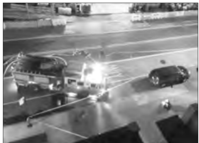
يجري التعامل مع موقع الانفجار على أنه مسرح جريمة

وأوضحت هيلاري كلينتون المرشحة الرئاسية عن الحزب الديمقراطي في تصريحات للصحافيين إنه