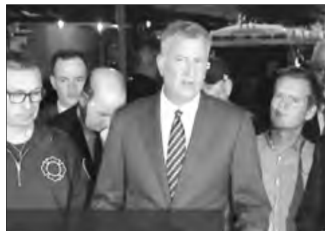
عمدة نيويورك بيل دي بلاسيو يقول إنه لا يوجد أي دليل حتى الآن على أن للانفجار صلة بالإرهاب

وجاء الانفجار بعد ساعات من انفجار قنبلة أنبوبية بولاية نيو جيرسي في منطقة كان من المفترض أن يمر بها المشاركون في سباق للعدو. ولم ترد تقارير عن وقوع إصابات، وقال دي بلاسيو إنه لا يوجد أي دليل على وجود صلة بين الانفجارين.