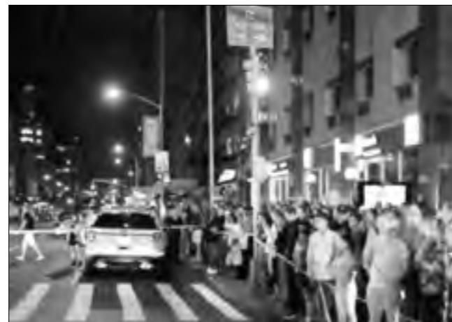
سمع دوي الانفجار على مسافة بعيدة

أصيب 29 شخصاً على الأقل في انفجار بحي مزدحم بمدينة نيويورك الأمريكية، بحسب مسؤولين.