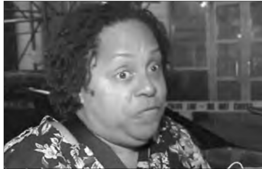
شهود عيان يصفون الانفجار بأنه كان «مروعاً جداً»

على اتصال بمسؤولي نيويورك. وقالت: نحتاج بكل تأكيد إلى فعل كل شيء ممكن لدعم الجهات التي تتعامل مع تبعات الحادث وندعو للضحايا». وأضافت: «سيكون هناك المزيد لأقوله عن هذا (الانفجار) حينما نعرف الحقائق في الواقع». وقال دونالد ترامب المرشح الرئاسي عن الحزب الجمهوري في كلمة لأمنائه أمام تجمع انتخابي في كولورادو إن هناك «قنبلة» انفجرت.