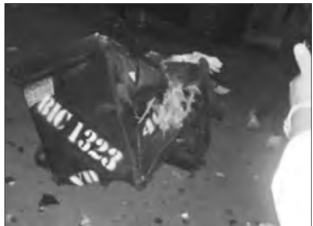
تقارير غير مؤكدة أفادت بأن الانفجار وقع داخل صندوق للقمامة