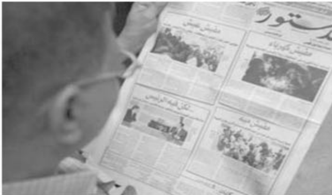
صحيفة الدستور المصرية

اعلن صحافيون في صحيفة الدستور المصرية اليومية المستقلة ان إبراهيم عيسى رئيس تحرير الصحيفة الذي اشتهر بمعارضة الحكومة اُقيل.