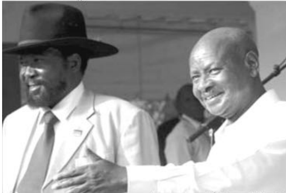
الرئيس الاوغندي مستقبلاً رئيس جنوب السودان

حذر عدد من الباحثين والاكاديميين من أن تصويت جنوب السودان لصالح الانفصال وإنشاء دولة جديدة سيهدد رغم بعض الفوائد الاقتصادية الظرفية - على المدى البعيد دولة أوغندا بالتفكك.