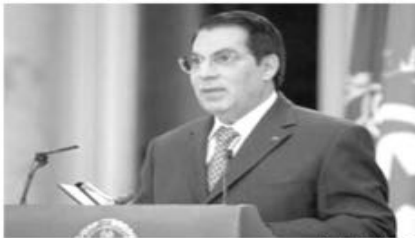
زين العابدين بن علي

ويشارك في اشغال المؤتمر الاسلامي الرابع لوزراء البيئة ٤٤ دولة أعضاء في منظمة المؤتمر الاسلامي و٢٧ منظمة دولية واقلية.