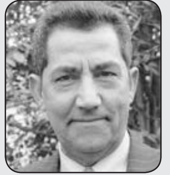
عبد الحميد صيام x

حدده الرئيس أوباما للانسحاب من أفغانستان وهو تموز (يوليو) ٢٠١١ وإبقاء الخيارات مفتوحة، وهذا الإلغاء سيلقى ترحيباً من صفوف الحرب من الحزب الجمهوري وعلى رأسهم جون ماكين، مرشح الرئاسة السابق.