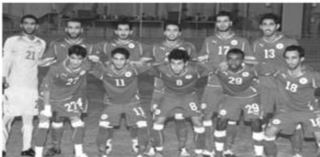
● منتخبنا الأولمبي لكرة القدم

مجموعة، بالإضافة لأفضل أربع فرق تحتل المركز الثالث لدور الـ 16 من البطولة.