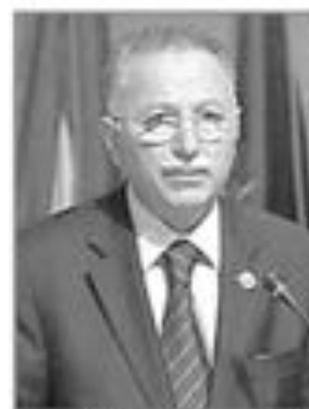
اكمل الدين إسمان أوغلر

افتتح الأمين العام لمنظمة المؤتمر الإسلامي البروفيسور اكمل الدين إسمان أوغلسو، مؤخرًا في شيكاغو في الولايات المتحدة الأميركية، الكلية الإسلامية في شيكاغو بعد انتهاء اشغال التجديد التي خضعت لها.