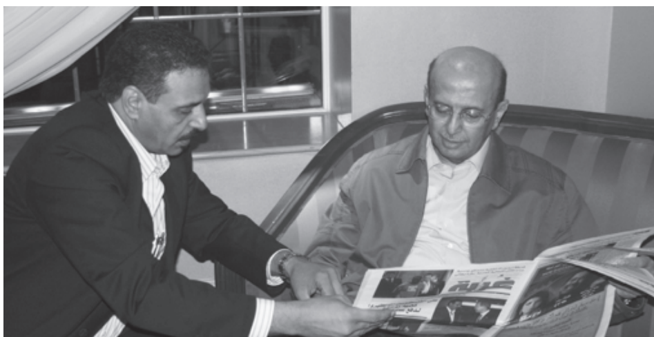
Abdo Almutti showing Dr Al karbi, yemeni foreign minister, Ghorba News paper