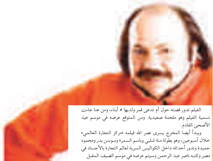
الفيلم تدور قصته حول أم تدعى قمر ولديها ٥ أبناء، ومن هنا جاءت تسمية الفيلم وهو ملحمة صعيدية. ومن المتوقع عرضه في موسم عيد الأضحى القادم. ويبدأ أيضا المخرج يسرى نصر الله فيلمه «مركز التجارة العالمي» خلال أسبوعين، وهو بطولة منة شلبي وباسم السمرة وسوسن بدر ومحمود حميدة وتُدور أحداثه داخل الكواليس السرية لعالم التجارة بالأجساد في مصر وكتبه ناصر عبد الرحمن وسيتم عرضه في موسم الصيف المقبل