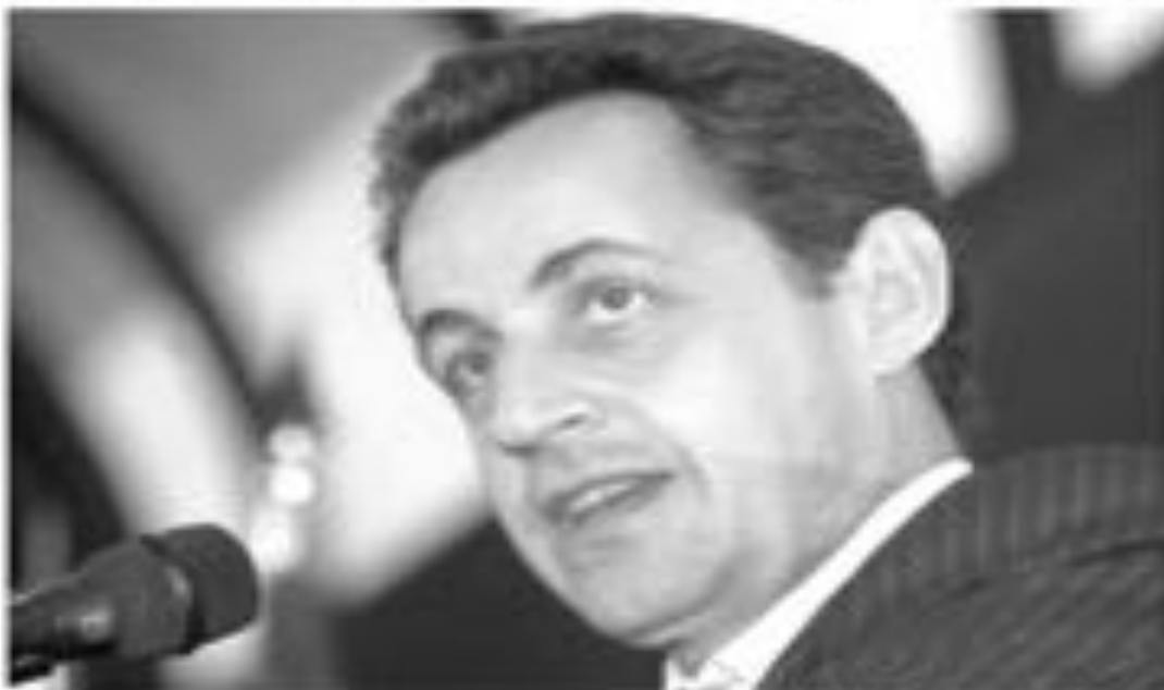
ساركوزي في مواجهة تهديدات القاعدة

العهد الرئيس الفرنسي نيكولاي ساركوزي ليس باعتبار جميع أجهزة الدولة في بلاطه للأمن من جميع الرهائن المحتجزين لدى تنظيم القاعدة في بلاد المغرب الإسلامي. وقال المتحدث باسم الرئيس الفرنسي لوك ستانول عقب الاجتماع الأسبوعي للحكومة أن ساركوزي أكد أنه ستتم تعبئة جميع الخدمات التي تقدمها الدولة للحصول على حرية الرهائن.