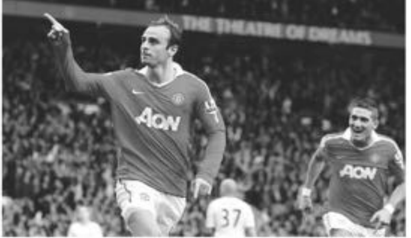
برباتوف يهتف بعد هدفه الذي قاد فريقه للفوز على ليفربول.