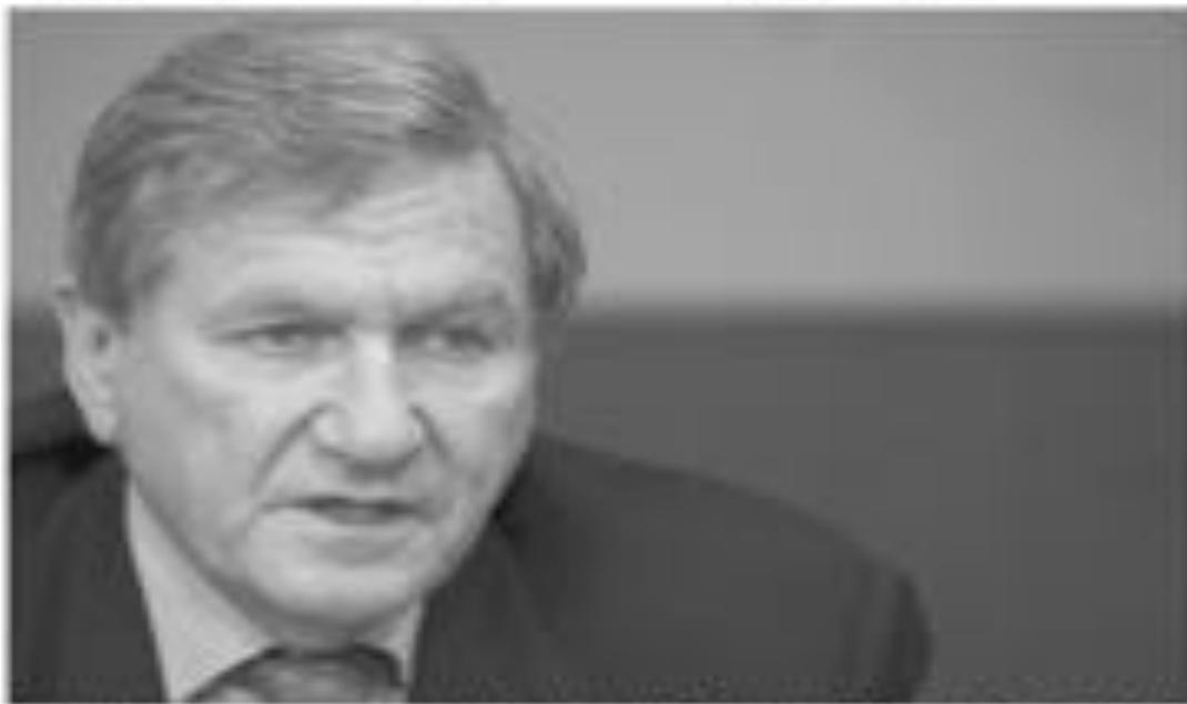
الجنرال الأميركي الخامس لأفغانستان وأفغانستان رينشارد هولبروك

الجنرال رينشارد هولبروك القوات الأميركية في أفغانستان الاستقرار في أفغانستان الاستقرار في أفغانستان الاستقرار في أفغانستان