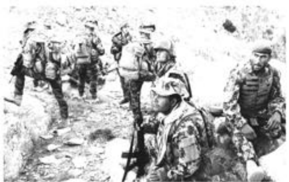
قوات أفغانية وفرنسية خلال عملية عسكرية في كابول

واشرف هولبروك بأن بعض العناصر المدنية في الاستراتيجية الأمريكية لا تزال الاستقرار في أفغانستان لا تسير بوتيرة سريعة كما كان متوقفاً ومن بينها جهود للمصالحة مع مقاتلين معتدلين في حركة طالبان وإعادة دمجهم في المجتمع الأفغاني. من جهة أخرى، أعلنت لجنة الشكاوى الانتخابية الأفغانية أمس