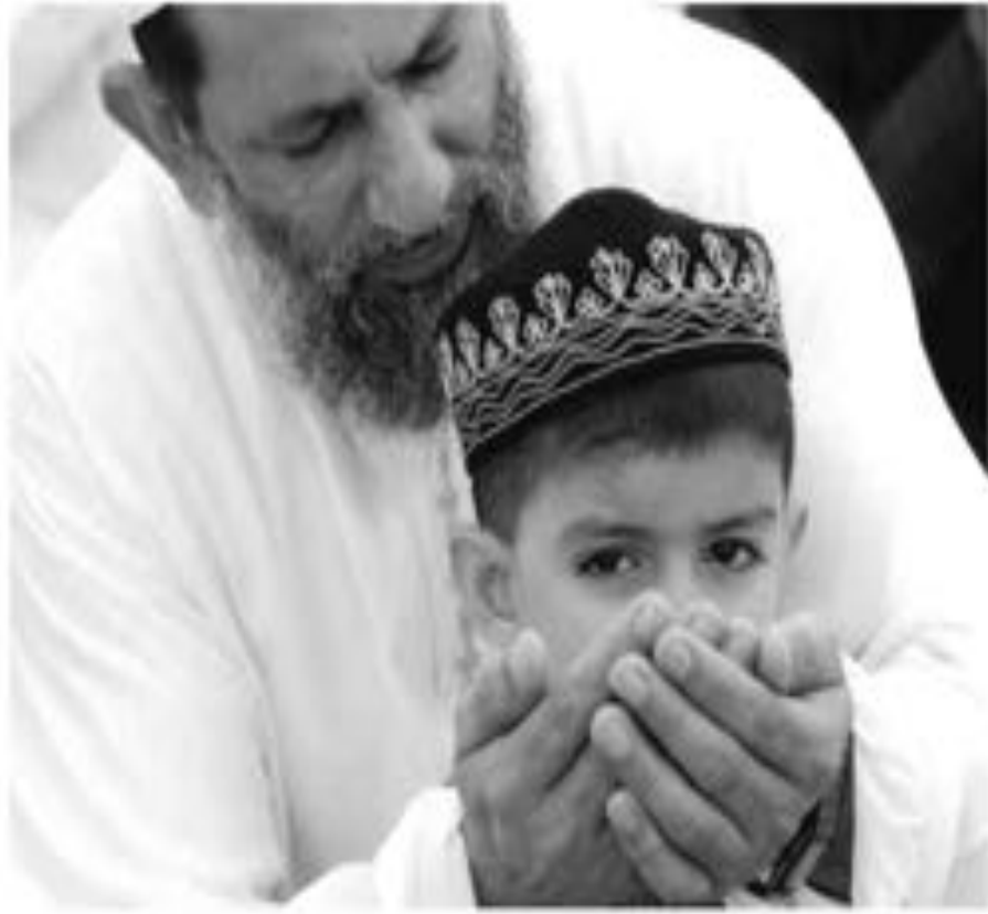
سير لا تقي وابنه يصليان في أوامير

وقل ربنا لا تعبدوا إلا إياه وبالوالدين إحساناً أما يعلن عندك الكبير استعجاباً أو كلاًهما فلا تقل لها الحمد ولا للهوهاً وقل لها قولاً كريماً إن نفس التي جعلها الله تعالى في استفهام هذا التعجب، إنما جاءت كي تبين أن ما يفتحه الله تعالى بعدها بعد من مجرد طلب وأصيل من مجرد امر، إنه قضاء ذلك أن الله تعالى نفس كم تأتي بعدها الأيتان آية هذا الأمر القاطع الذي شكل حسب العقائد الصغرية كلها «عبادة الله وحده» فدعها عز وجل بعد «قضاءه» لهاينها «الوالدين إحساناً» إن الربط الذي جاء، عبر العطف بحرف «الواو» له من الدلالة التي، العيب، ذلك أن إرادة الله تعالى جعلت هنا «عبادته» عز وجل «المقدمة» التي أراد لها أن تتم هنا بالاحسان إلى الوالدين، وحتى يظل هذا صيغته ولفظي أعني هذا الاحسان، قدم لنا التفاصيل للعقل به، فالله يوضح إلى فترة زمنية، يضيح فيها هذا الاحسان الكثر العائلاً، يعلن عندك الكبير أيهما كان، شديداً تصيح «ألف» التي معبرتها التامر، مرفوضة، ذلك على أن هذا التامر من حيث الألف مرفوض أيضاً، فما بالك إذا تطورت الألف إلى «الهمزة» كما كانت صيغة انتهى التوجيه الألفي كما حملته كلمات هذه الآية التي يرمي إلى نسخ واضح لا ليس فيه استبدال هذا القيل «ألف» أو «الهمزة» بالقول الكريم، ومجاناً كريمةً بالذات دون غيرها من الصفات التي قد على أن هذا القول يجب أن يجعل علامات جنس الكرامة والآلات صادق التكريه، الذي يجب أن يأتي مشفوعاً بالكرم الألف الذي يجب أن يوضح الرغاية والعناية فيما 16 حدث وكان أن بلغ كلاًهما أو أحدهما الكرم، هكذا ارتكنا المسألة المتشعبة هنا دون أن نصل إلى دالات الرحمة في هذه الآية، والتي سنأتي في الأسبوع القادم بحول الله، بلبح.