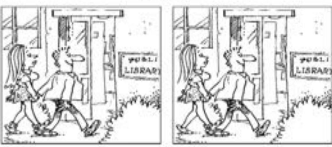
من الرسيم الفاء لحسة لبارلي - حاشيا