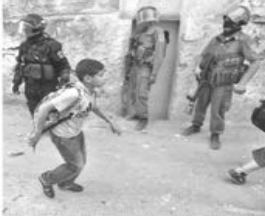
مستوطنون يلاحقون طفلاً فلسطينياً في حيّ الشيخ جراح في القدس المحتلة، 2010.

في العقد الخامس من الاحتلال، قتل ما يقارب مائة ألفاً من الفلسطينيين، وذلك على يد القوات الإسرائيلية، وفقاً لبيانات منظمة الصحة العالمية. وتعدّ هذه الأرقام من بين الأعلى في تاريخ البشرية، حيث قتل ما يقارب مليوناً من المدنيين في العراق خلال العقد الأول من الاحتلال.