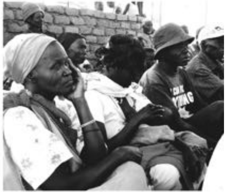
سودانيو الجنوب يتربصون استفتاء يناير المقبل - أ.ح.ب.ب.

قالت كلينتون إن الباب مفتوح أمام السودان لتحسين العلاقات مع الولايات المتحدة في خطوة ترمي على ما يبدو إلى إقناع الخرطوم بالتعاون في