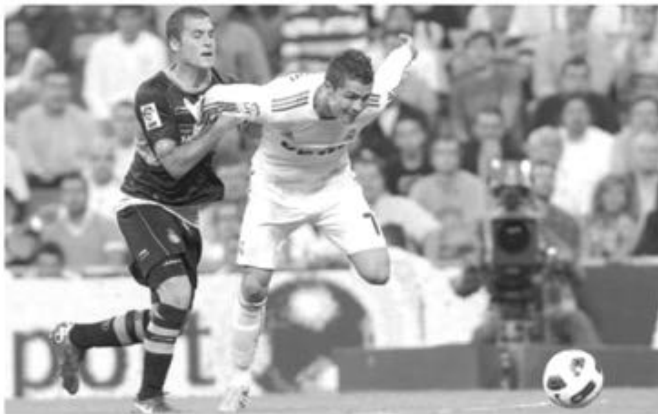
● من لقاء ريال مدريد مع إسبانيول يوم أمس الأول

تحدثت المدرب البرتغالي جوزيه مورينيو عن الفوز الذي حققه ريال مدريد يوم أمس الأول على حساب إسبانيول (0/3) ضمن الجولة الرابعة من الليجا الإسبانية حيث أعرب عن ارتياحه التام بعد حصوله على النقاط الثلاث.