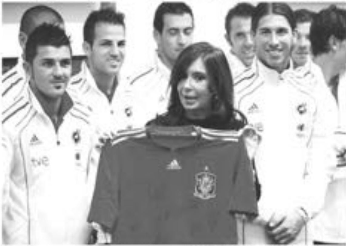
الرئيسة الارجنتينية كورينا فيرر تستقبل لاعبي المنتخب الاسباني بعد فوزهم في المباراة النهائية على

المنتخب الارجنتيني في المباراة النهائية على ملعب مونتيفيديو في 3 يونيو 2010. وكانت كورينا فيرر هي الرئيسة الارجنتينية التي استقبلت المنتخب الاسباني بعد فوزه في المباراة النهائية على ملعب مونتيفيديو في 3 يونيو 2010. وكانت كورينا فيرر هي الرئيسة الارجنتينية التي استقبلت المنتخب الاسباني بعد فوزه في المباراة النهائية على ملعب مونتيفيديو في 3 يونيو 2010. وكانت كورينا فيرر هي الرئيسة الارجنتينية التي استقبلت المنتخب الاسباني بعد فوزه في المباراة النهائية على ملعب مونتيفيديو في 3 يونيو 2010.