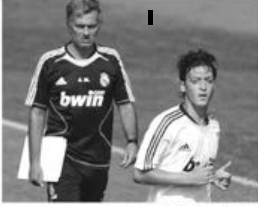
زيدان مع مورينيو بعد فوز ريال مدريد على مانشستر يونايتد في المباراة النهائية لكأس اوروبا.

الريال مدريد بقيادة المدرب جوزيه مورينيو فاز على مانشستر يونايتد في المباراة النهائية لكأس اوروبا. وقال زيدان ان مورينيو يحمل معه ما كان يفقده الريال. وقال زيدان ان مورينيو يحمل معه ما كان يفقده الريال. وقال زيدان ان مورينيو يحمل معه ما كان يفقده الريال.