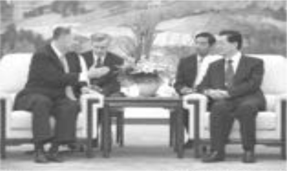
الرئيس الصيني يتلقى الوفد الأمريكي

ومعظمي سوتيلون يسوق الكفاءات جئوسا إلى جوار الرئيس الصيني كانت مباحثات مشرة والقضايا الاقتصادية والأمنية. وأم يكر أي من الجانبين ما هي التوسعات التي استمرت خلال العبادات التي استمرت خلال ٢٠٠٩ أيام والتهدد من والتي شملت اجتماعا بين ساسون وتيسو شينوا تشوان محافظ البنك المركزي الصيني الذي يوجه السياسة النقدية لكن الجانبين كان الماسهما الكثير من التوسعات التي يمكن التطرق إليها. والرئيس الصيني يتطلع لزيارة الولايات المتحدة في الوقت المناسب المقبل وهي خطوة سياسية مهمة بالخدمة الخارجية في الوقت الذي يدخل فيه في آخر عامين من منصبه ويرغب الجانبين فيهما دعم التطرق إلى التورات قبل تلك الزيارة وكذلك فيما مجموعها العشرين والقسم الإقليمية التي تعقد في وقت لاحق من العام التجاري عندما ستكون هناك أيضا فرصة لقاء أوباما بنظيره الصيني. وقال هو انظر الصين بأيجابية للتقدم الذي أحرز حديثا في العلاقات الصينية الأميركية ونحن مستعدون للتعاون مع الولايات المتحدة في تشجيع القسي قديما في علاقات صينية أميركية صحية ومستقرة. (رويترز)