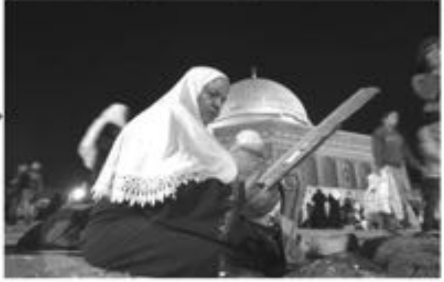
مراة تسجد بحمد الله رب العالمين في صلاة الصلوة

أثر الإيمان في مواجهة الإحباط... حيث يشعر الإنسان بالإحباط... ويبحث عن سبل للتغلب على هذه الحالة... من خلال الإيمان بالله... الذي هو سر النجاح في كل شأن... حيث لا يفتقر المؤمن إلى شيء... بل هو كالماء الذي لا ينضب... والحمد لله رب العالمين.