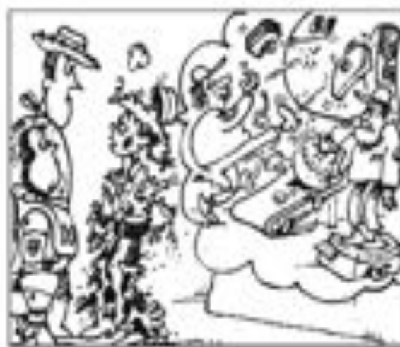
من الرسوم الكاريكاتورية - جازي