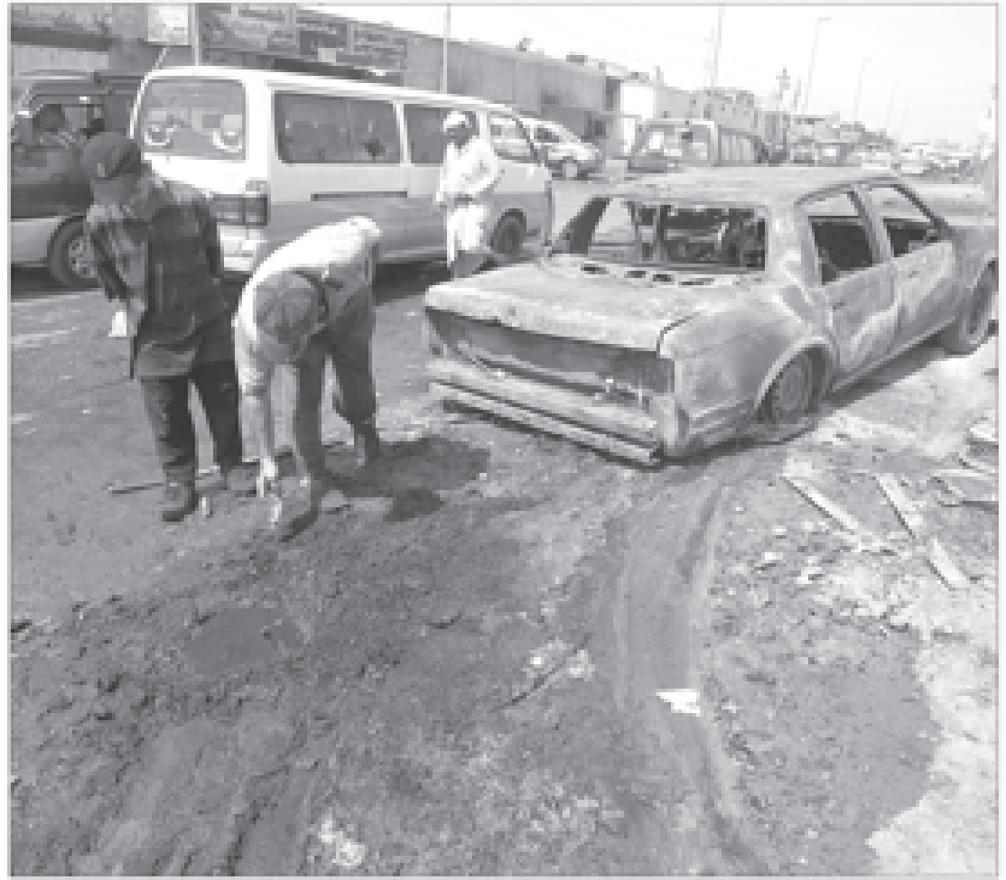
عراقيان بالقرب من سيارة متفجرة في موقع تفجير في شارع الشيخ عمر ببغداد أمس

حدت قائمة «العراقية، بزعامة رئيس الوزراء الأسبق ابياد علاوي أمس من نهاية التجربة الديمقراطية في العراق إذا لم يتم احترام نتائج الانتخابات التي اسفرت عن فوزها على ائتلاف دولة القانون بفارق مقعدين. وقالت عضو القائمة عالية نصيف لفرانس برس «إذا لم نلتزم بالدستور، وإذا لم نلتزم القوائم بنتائج الانتخابات، فإن الديمقراطية لن تستمر في العراق وذلك باعتراف القياديين في ائتلاف دولة القانون، بزعامة رئيس الوزراء المنتهية ولايته نوري المالكي. وأضافت ان «العراقية تؤكد انها تتمتع، وخصوصاً زعيمها علاوي، بعلاقات ممتازة مع كافة دول العربية ودول المنطقة إلا ان بعض القنصل يعترض العلاقات مع