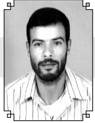
محمد ملوك كاتب مغربي

تسلخ البهيمة البكماء ، بثمة التخرج من جامعات العلم والعلماء ، والحصول على شواهد عليا لا تتوافق ومطالب البلد المكتظ بمثل هؤلاء؟؟؟