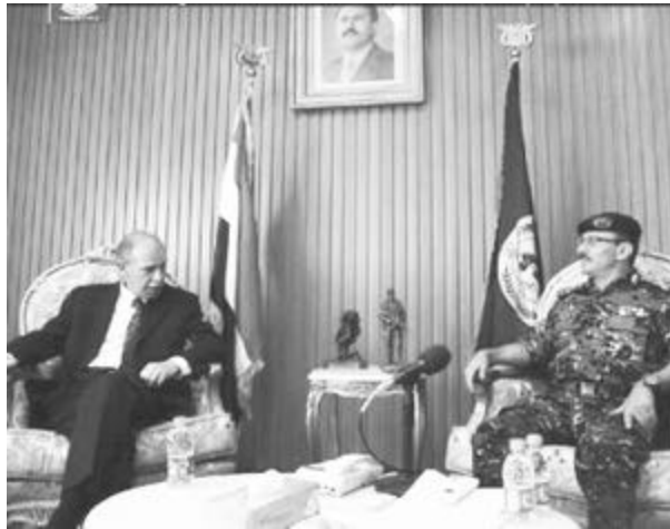
المستمر لأمن واستقرار اليمن، وكذا تقديم الدعم المستمر لوحدة مكافحة الإرهاب.