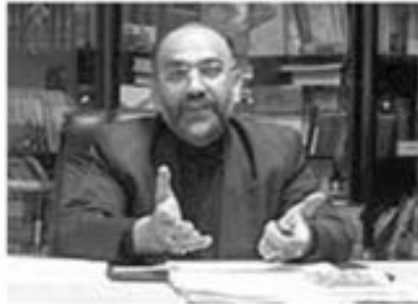
● مهدي خزعلي

الإصلاحية والمنشقين والصحافيين وأصحاب المدونات الإلكترونية وقد صدرت بحق بعضهم أحكام قاسية. على سعيد آخر ذكر وزير النفط الإيراني مسعود مير كاظمي أمس في فيينا أن العقوبات الدولية على إيران لم تضر بقطاع النفط في البلاد. وكانت شركات نفط غربية قد أعلنت الشهر الماضي أنها ستقطع علاقاتها التجارية مع إيران لتفادي عقوبات محتملة بموجب قانون أمريكي يهدف إلى إثناء الشركات الأجنبية عن الاستثمار في قطاع الطاقة في البلاد. وفي رد على سؤال الصحافيين حول تلك العقوبات وغيرها خلال مؤتمر لمنظمة الدول المصدرة للنفط «أوبك» قال مير كاظمي «لا توجد أضرار أيا كانت». وحذر الوزير من أن الدول تضر بنفسها باستهداف قطاع النفط في إيران. وأضاف «أمن الطاقة بدون إيران ليس له معنى». وتابع أن إيران لديها ما يكفي من الإمكانيات لمعالجة النفط وتعترم بناء ست مصافي نفط جديدة خلال الأعوام الثلاثة المقبلة. ولم يوافق المحتلون على مزاعم مير كاظمي.