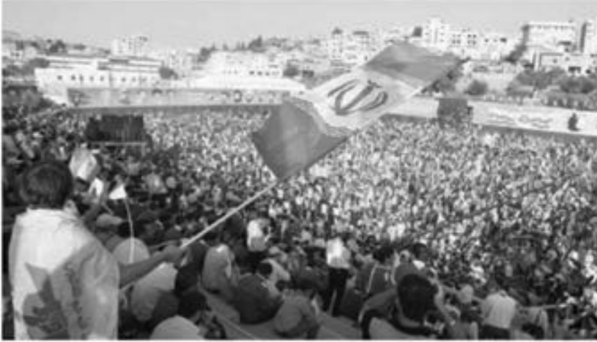
● مؤيدون لحزب الله يحتفلون بزيارة نجاد خلال إلقاء خطابه في بنت جبيل أمس، (رويترز)

الرئيس الإيراني في بيروت محادثات مع رئيس الحكومة سعد الحريري انضم إليها رئيس الجمهورية ميشال سليمان ورئيس المجلس النيابي نبيه بري. وشارك الجميع في وقت لاحق في مأدبة غداء دعا إليها الحريري في السراي وشارك فيها عدد كبير من الشخصيات السياسية والدبلوماسية. ويعد اجتماعه مع الحريري تسليم نجاد الدكتوراه الفخرية في العلوم السياسية من الجامعة اللبنانية والتي كلمة أمام طلاب الجامعة.