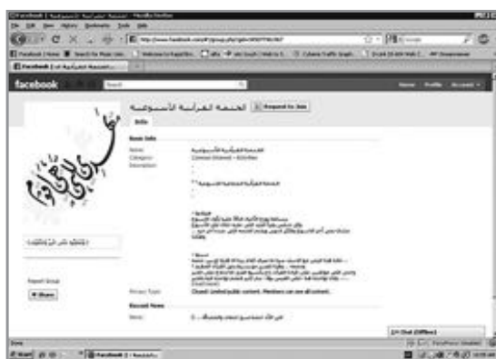
الصفحة الخاصة بالختمة عبر الفيس بوك

وشبه بيومي «فيس بوك» بأي آلة أخرى، معتبرا أن «الأمر يختلف باستخدام الآلة، كالمسكين فمن يستخدمها في غرض مشروع فهي حلال ومن يستخدمها في غير ذلك فهي حرام».