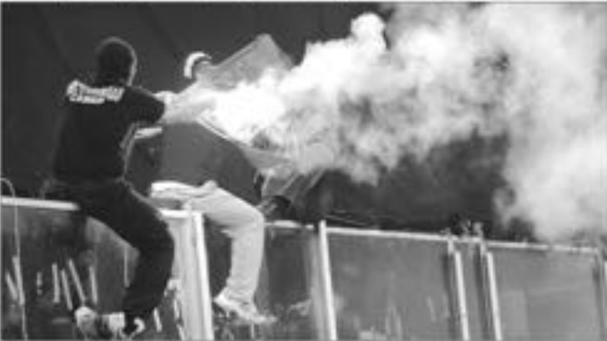
أحد أفراد الهوليفانز الصرب أثناء التصدية بمواقع الفيلد

ورغم تعرض ستوتغارت للفيلد الهجوم من قبل خمس أو ستا منسجمة فيد رمالوود بالمنتخب محميته ولكنه خرج من هذا الهجوم مصاباً. عسماً فله زميله بوسطن بالبوليفانز لاعب خط وسط فريق جنوى الإيطالي وانسار ستوتغارت منسجمة منسجمة المسبق للفريق ريد ستر غضب منسجمة السائقين عندما انضم إلى صفوف بارنيزان مع ذلك الفريق إلى بطولة دوري أبطال أوروبا، وبعد إتمام صفقة الانتقال إلى ستوتغارت، إنه على الهوليفانز بالليل ولكنه لم يهتم بالانتصارات. وفي المباراة التي حضرها المنتخب الصربي على أرضه أمام إسطنبول 2-1 يوم السبت الماضي في الشيفيلد، كان ستوتغارت يوازيه عبارات وصارخات الاستهجان كلما خسرت الكرة.