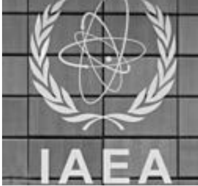
الوكالة الدولية للطاقة الذرية

وقد تثير أي خطوة من هذا النوع غضب دمشق التي تحسنت علاقاتها مع واشنطن بعد أن تولى الرئيس الأميركي باراك أوباما الحكم عام ٢٠٠٩. واذا كانت سوريا سترفض طلبا محتملا بإجراء تفتيش