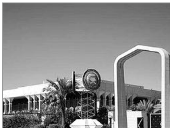
مجمع الملك فهد لطباعة المصحف الشريف

وتزويد كل من وزارة العدل في مملكة البحرين، ونائب رئيس مجلس الوزراء للشؤون القانونية وزير العدل ووزير الأوقاف والشؤون الإسلامية بدولة الكويت، والوفد الدائم للمملكة لدى جامعة الدول العربية، والمعهد الكاتبي الأدبي لتحفيظ القرآن الكريم بجمهورية نيجيريا، ووقف الأعمال الخيرية والاجتماعية بالجمهورية اللبنانية، ومؤسسة ومجمع مدارس ابن خلدون الإسلامية في مدينة أكرا بغانا.