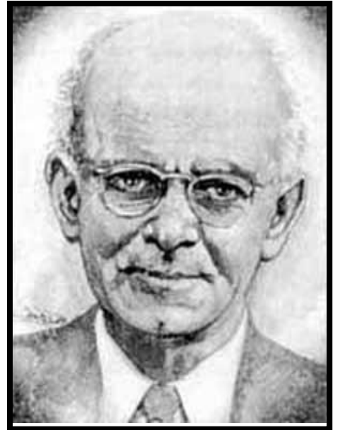
إيليا أبو ماضي

كن بلسماً إن صار دهرك أرقما إن الحياة حبتك كل كنوزها أحسن وإن لم تجز حتى بالثنا من ذا يكافئ زهرة فواحة ؟ عد الكرام المحسنين وقسهم ياصاح خذ علم المحبة عنهما لو لم تقح هذي، وهذا ما شدا، فاعمل لإسعاد السوى وهنائهم