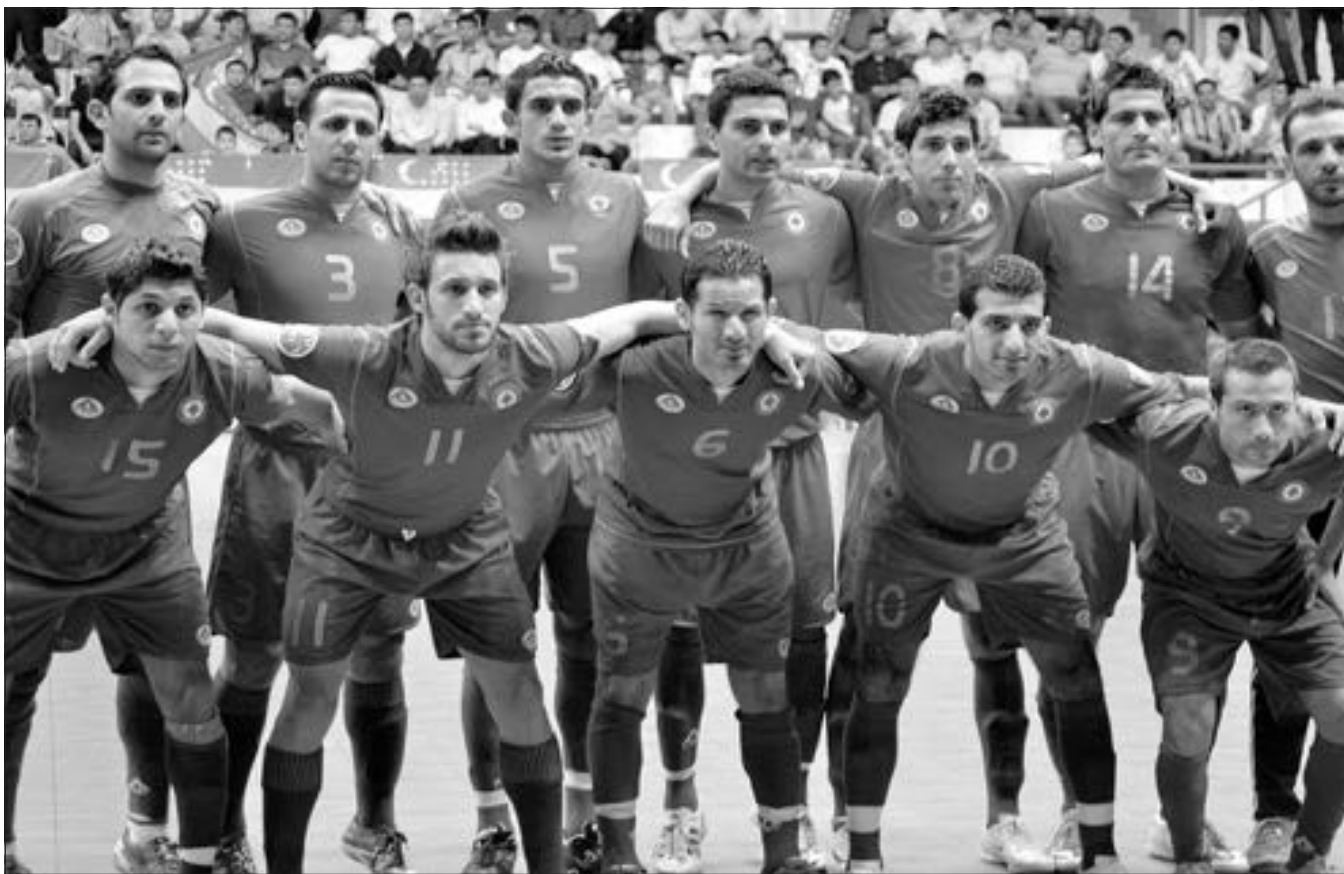
المنتخب اللبناني لكرة الصالات لتأكيد جدارته

تعود عجلة الدوري الألماني لكرة القدم إلى الدوران بعد النجاحات الأخيرة لمنتخب ألمانيا في تصفيات كأس أوروبا ٢٠١٢، فيخوض ماينتس مفاجأة الموسم امتحاناً جدياً عندما يستقبل هامبورغ القوي غداً السبت ضمن المرحلة الثامنة التي تفتتح بقاء بوروسيا دورتموند الوصيف مع مضيئه كولن اليوم الجمعة.