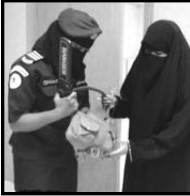
القرار فستعمل النساء في وحدات مستقلة عن الرجال.

وكانت شائعات سابقة قد دارت حول علاقة خفية يقيمها كوتشور مع فتاة أخرى، إلا أن مور كذبت جميع هذه الشائعات وساندت زوجها في هذه المحنة.